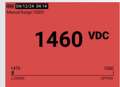
Grenzwertanzeige - außerhalb des Bereichs